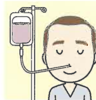
経管栄養 (経鼻・胃ろう)