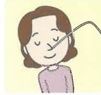
痰吸引（かくたんきゅういん）