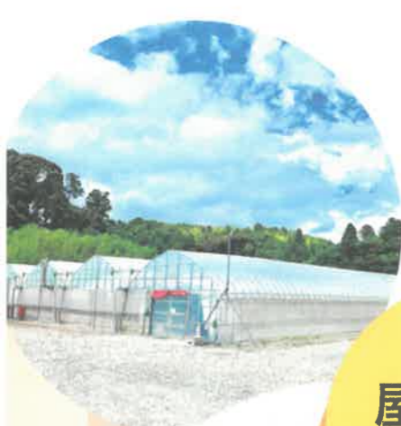
屋外農園 (ビニールハウス型)

日報は、朝その日の体調など記入し終礼前に仕事内容や感想を記入します *企業により内容は異なります