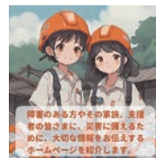
名刺サイズチラシ(裏面)

大きな地震や台風などの災害に備えるためには、必要なものや助けてくれる人を事前に確認することが大切です。本サイトでは、障害のある方の災害対策の情報を紹介しています。「もしも」に備えることで、安全で安心な生活を目指しましょう。