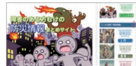
障害のある方むけの「防災情報」まとめサイト