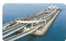
東京湾アクアライン