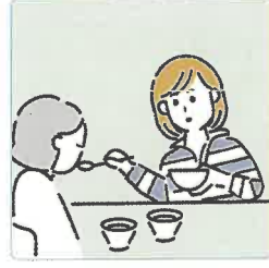
障害や病気のある家族の身の回りの世話をしている。