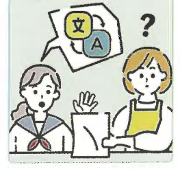
日本語が第一言語でない家族や障害のある家族のために通訳をしている。