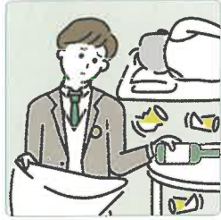
アルコール・薬物・ギャンブル問題を抱える家族に対応している。