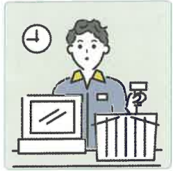
家計を支えるために労働をして、障害や病気のある家族を助けている。