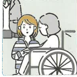
障害や病気のあるきょうだいの世話や見守りをしている。