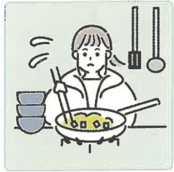
障害や病気のある家族に代わり、買い物・料理・掃除・洗濯などの家事をしている。

本来大人が担うと想定されている家事や家族の世話などを日常的に行っていること。責任や負担の重さにより、学業や友人関係などに影響が出てしまうことがあります。