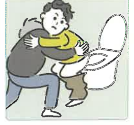
障害や病気のある家族の入浴やトイレの介助をしている。

ヤングケアラーは、家事や家族の世話などをがんばっているからこそ、こんな気持ちを持っているかもしれません。