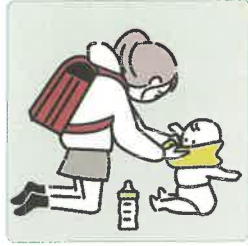
家族に代わり、幼いきょうだいの世話をしている。