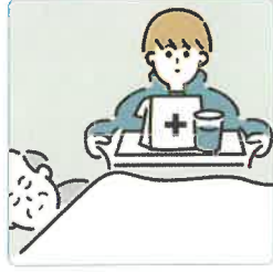
がん・難病・精神疾患など慢性的な病気の家族の看病をしている。