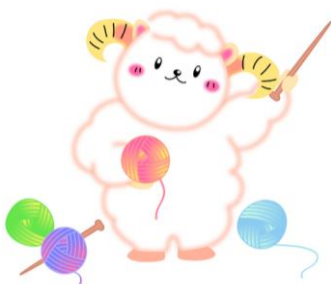
イメージキャラクター 「とわぶる」