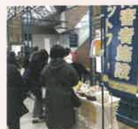
令和4年度 物販の様子