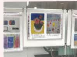
令和4年度 作品展示の様子