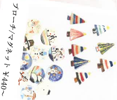
ブローチ/ワグネット ￥440～

販売会でも大好評の さつき共同作業所さんの陶器。 手作りならではのあたたかみを 感じられる作品たちです。