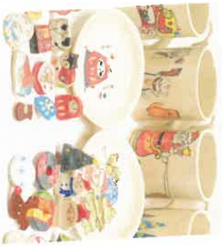
箸置き ￥110～ ワグカツプ ￥1,000～

販売会でも大好評の さつき共同作業所さんの陶器。 手作りならではのあたたかみを 感じられる作品たちです。