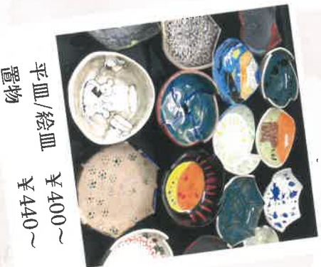
平皿/絵皿 ￥400～ 置物 ￥440～

さつき共同作業所は、ハンディのある方々が通所し、個々の目的や希望を叶えるために自身の障がいと向き合い、ひとりひとり様々な思いを持ちながら、仕事や創作活動をおこなう場所です。ひとりひとりみなんで協力しながら手掛け完成した、個性あふれる色とりどりの作品です。どうぞお手にとってご覧ください。