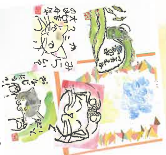
ポストカード ￥150～ 絵と作品の展示

そのほかにも、 ・アートのラリー ・紙刺繍のカード ・折り鶴のアクセサリー ・しおり なども販売します！