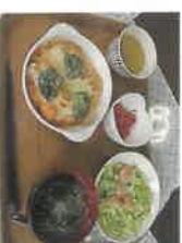
チキンとブロッコリーのトリア