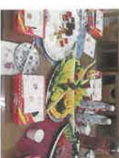
クリスマス会の食事