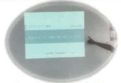
ビジネスマナー講座