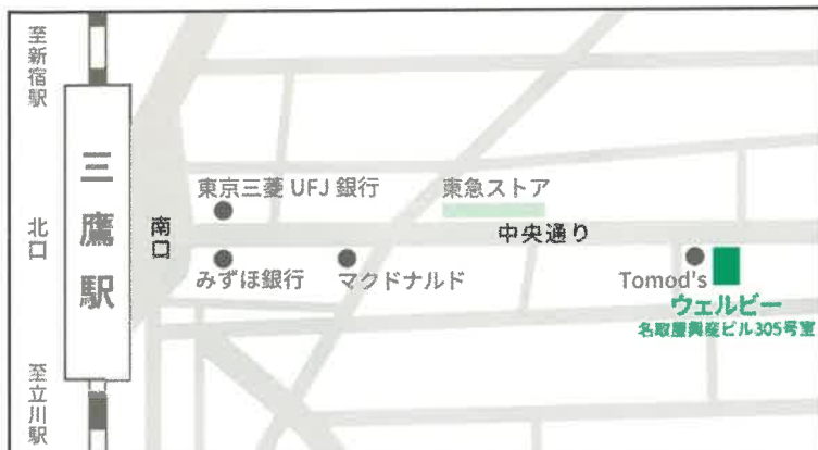
JR中央本線（中央線快速、中央・総武線）「三鷹」駅（南口）徒歩5分