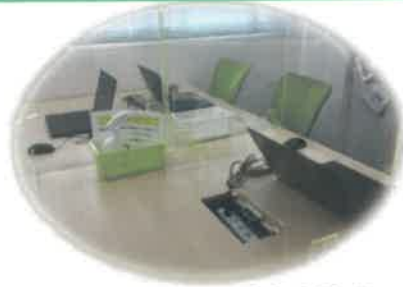
WITパソコン訓練体験