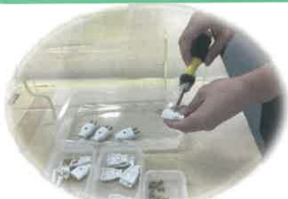
ベーシクトレーニング体験