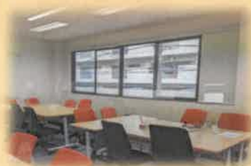
Officeの中は広々とした 空間です

国分寺駅前officeは駅の南口から徒歩3分程と駅近です！ ビルの2階にありますが、看板も出ていますので見つけやすいです。 大きな窓がたくさんある、明るいofficeとなっております♪ オープンしたばかりで中もピカピカです。きれいなofficeで、就職への 第一歩を踏み出してみませんか？