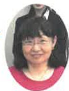
高2男の子のお母さん

息子は小学校1年生から不登校に。本人が安心して通えるだけでなく、親がきちんと子どもに関する理解をできるように導いてもらえるところが安心できました。今では自らの意思で高校に通い、将来の夢も語るようになりました。トンネルの先の見えない光を目指してコツコツ続けてきたことが実り、希望を持っています！