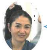
小2男の子のお母さん

幼稚園入園前から通っています。アセスメントを通して、親が息子の行動の理由を理解して、段階的に目標に向かって取り組めることが心強いです。小さい頃から手を添えて教えたり学習の習慣をつけられたことが学校に入学した後も役立っています。先輩のお母さんとお話できたことも、先の見通しがたてられ、頑張ろう！と思えました。