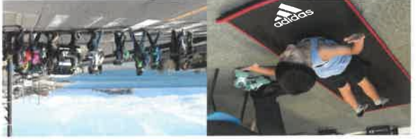
ダンス、運動療育 リリックスエクササイズ