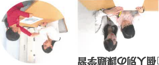
学習の基礎を身につける